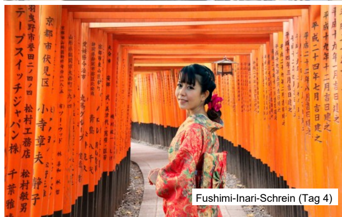
Fushimi-Inari-Schrein (Tag 4)