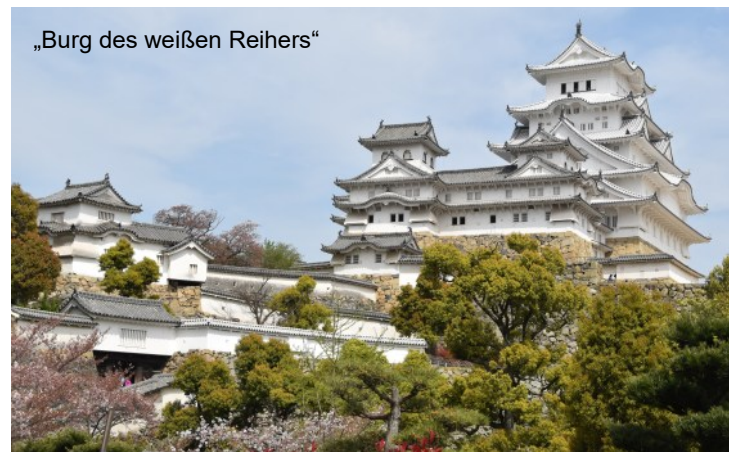
„Burg des weißen Reihers“

Was wäre eine Reise in Japan ohne den Shinkansen-Expresszug? Seit mehr als 60 Jahren braust dieses japanische Wunderwerk un-