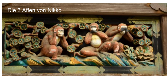
Die 3 Affen von Nikko

sche Puppen des 19. Jahrhunderts oder bunte Anime-Figuren verkleiden, gehören genauso dazu wie schrille Werbung für die farbenfrohe Mode. Am späteren Nachmittag erobern wir den Stadtteil Shibuya mit der von Menschenmassen im Minutentakt überquerenden weltberühmten Kreuzung. Zudem lernen Sie die anrührende Geschichte des treuesten Hundes der Welt, Hachiko, kennen, dessen Schicksal in Hollywood mit Richard Gere verfilmt wurde. Der Besuch einer der vielen Aussichtsplattformen mit Blick auf die Stadt rundet diesen einmaligen Tag in der Millionenmetropole ab. Erst von oben versteht man, dass die Ausbreitung der Stadt nur von Bergen und Meer in Zaum gehalten wird.