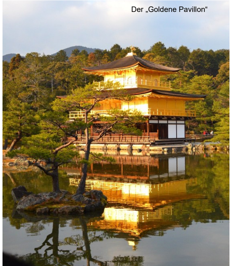
Der „Goldene Pavillon“

de der Welt mit der größten jemals hergestellten Gussbronze aus dem 8. Jahrhundert wird Ihnen die Sprache verschlagen. Sie erleben zudem die handzahmen, aber frei umherstreifenden Sikahir-sche der Stadt, die gerne alles anknabbern, was sie erhaschen können - ulkige Szenen mit dem Rotwild inklusive.