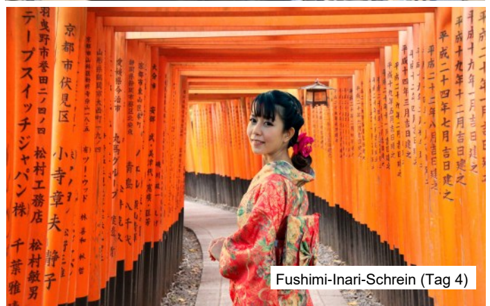
Fushimi-Inari-Schrein (Tag 4)

Preis folgt ca. Mitte Juni 26, lassen Sie sich vormerken