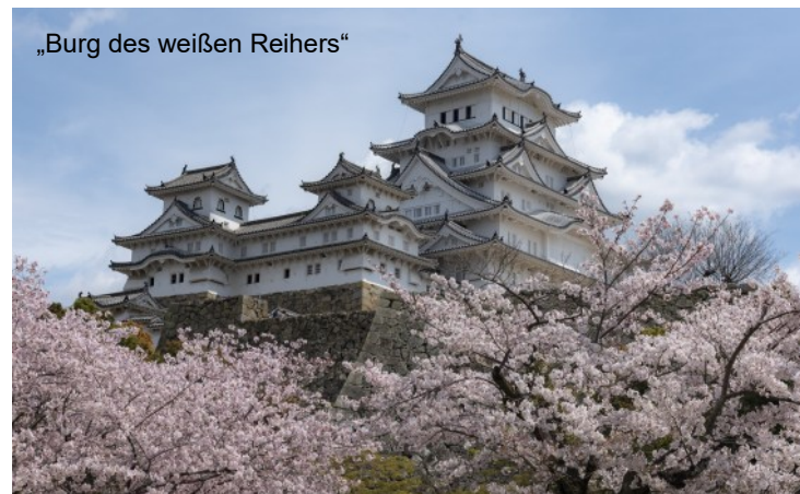
„Burg des weißen Reiher“

Was wäre eine Reise in Japan ohne den Shinkansen-Expresszug? Seit mehr als 60 Jahren braust dieses japanische Wunderwerk un-