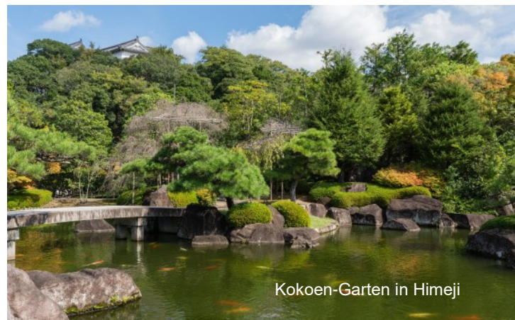
Kokoen-Garten in Himeji

Am Nachmittag geht es dann weiter in die japanischen Alpen, wo